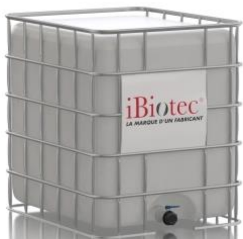
Container 1000 L